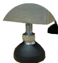
→ Einstellbare Gerätebeine