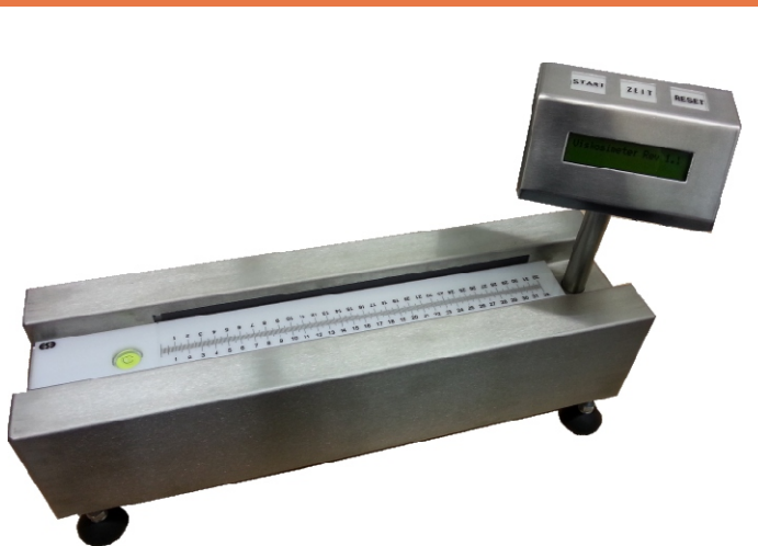
→ "Touch" Bedienung / LCD Display